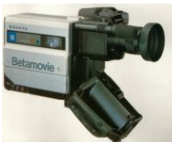
The First Camcorder, 1983

Macam-macam camcorder: miniDV, DVD camcorder, dan digital8.