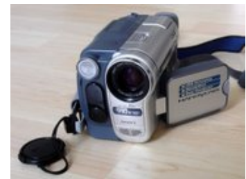
Sony DV Handycam